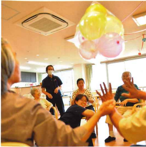
↑ デイサービスセンター希 風船パレード風景 円になってトスを繋ぎ、前回より大幅に記録を伸ばしました。