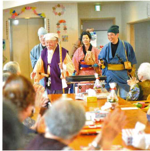
↑ デイサービスセンター恵 誕生会風景 なんと初代水戸黄門のそっくりさんがお祝いに駆け付けてくれました！