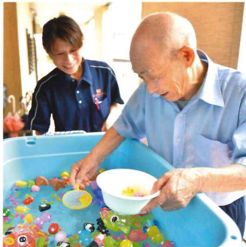
↑ デイサービスセンター恵 西須賀 夏祭り風景 ヨーヨー釣りや射的などを楽しんだ後は皆でスイカとかき氷を食べました。