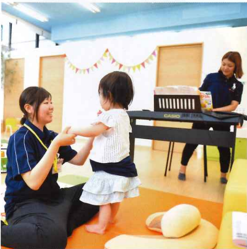
↑ いつもすまいる ミュージックケア風景 大好きなお歌に合わせて遊びを取り入れたリハビリをしました。