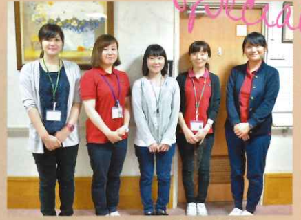
医療法人 睦み会 城西病院 相談室・地域連携室

今回は、城西病院 地域連携室 水本室長を始め、ソーシャルワーカーの皆様にお話をお伺いしました。