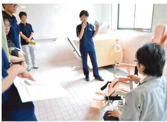
特殊浴槽の研修風景

9月のイツモ阿南オープン時にも、しっかりと研修を実施し、安心してご入居していただけるよう準備をしていきます。