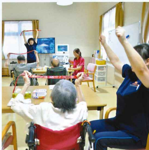
↑ デイサービスセンター恵 小松島 紐を使って体操をしました。身体を ぐーっと伸ばすと気持ちがいいですね。