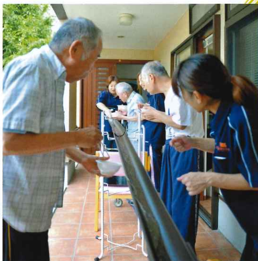
↑ デイサービスセンター恵 西須賀 流し素麺風景 冷たい水と共に流れてくる素麺を皆さ ん見事にキャッチ！されていました。