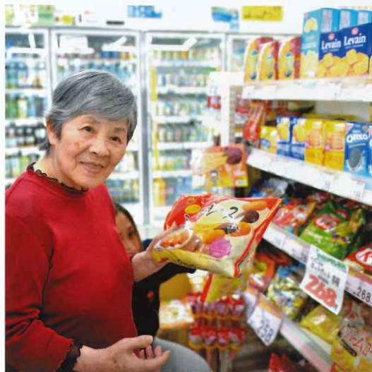
↑ グループホーム恵 買い物風景 天気の良い午後、近くのお店へ行って お買い物を楽しみました。