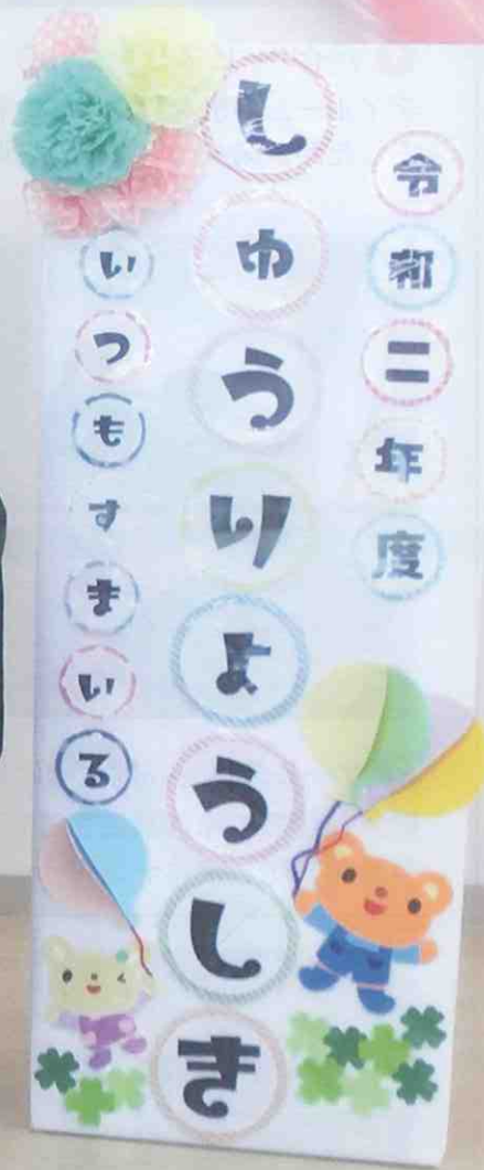
児童発達支援事業所イツモすまいる 修了式