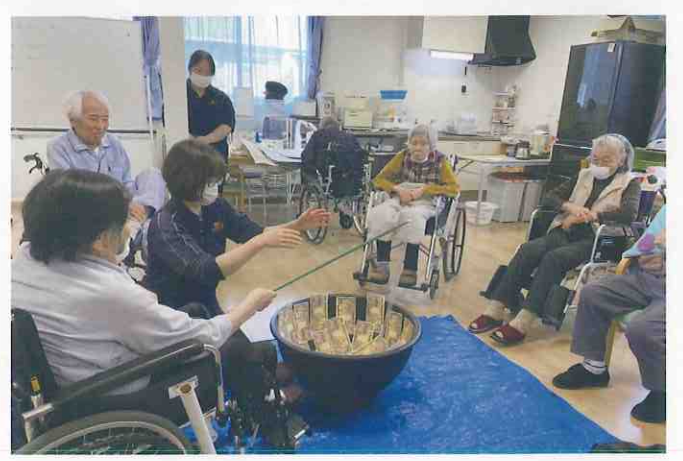
↑ デイサービスセンター恵阿南 (阿南市・宝田町)

今回のレクリエーションはお魚釣りではなく、お金釣り「大金持ちゲーム」をしました！利用者様がお札を釣り上げる度に「本物だったらいいのになぁ♪」と笑顔がこぼれ周囲の利用者様と盛り上がっていました。