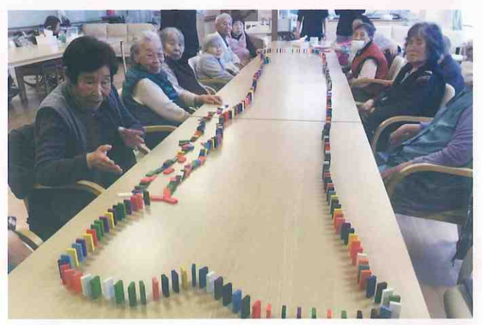
↑ デイサービスセンター希 (阿南市・宝田町)

ダイルールの机をならべて、利用者の皆さままでドミノ倒しをしました。途中で倒れないかハラハラドキドキしましたが、スタート地点から時計回りに倒れ始めたドミノは皆さんの前を倒れ続け見事にすべて倒れました！