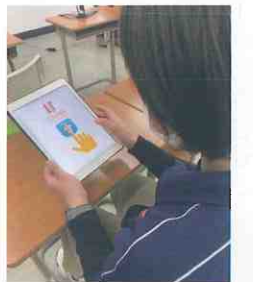
▲実際にアプリを操作

先日プレスリリースが行われた非接触型ビデオ通話ナースコール「イツモツナガルアプリ」について多数のお問合せをいただいています。