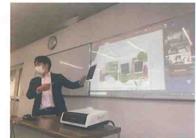
▲講師による概要の説明