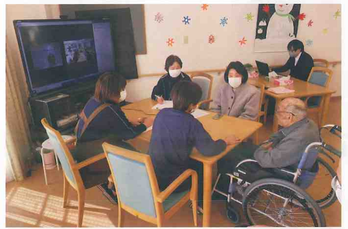
↑ サービス付き高齢者向け住宅ともだち倶楽部 (徳島市・中常三島町)

県外在住のご家族様にもご参加いただき利用者様のカンファレンスをオンラインで行いました。ご家族、看護師、ケアマネージャー、施設管理者の顔が見えて連携ができるとご好評をいただいています。