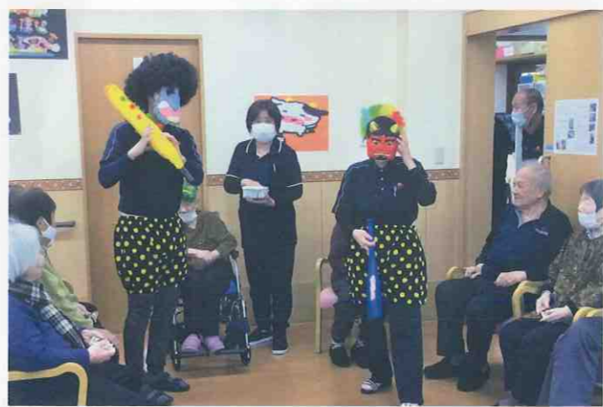
↑ デイサービスセンター 恵西須賀 (徳島市・西須賀町) 金棒を持ち派手なパンツを履いた鬼役の職員も気合十分！近寄る鬼たちに利用者様も負けず「こらー！」と声をあげながら豆を投げつけて…カラフルなヘアスタイルの鬼をやっつけてしまいました。