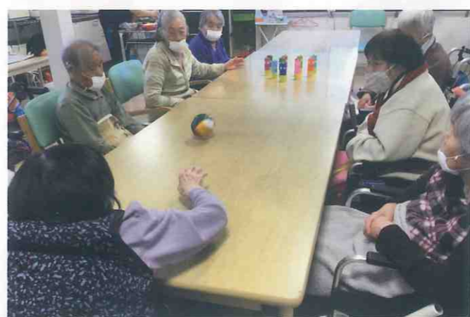
↑ デイサービスセンター恵阿南 (阿南市・宝田町) 鬼の絵を描いたピンをボールで倒していく「鬼退治ボウリング」をしました。ゲーム中に職員扮する鬼が現れ、利用者様を怖がらせようとしますが、利用者の皆さんは怖がるどころか笑顔で豆まきを楽しめました！