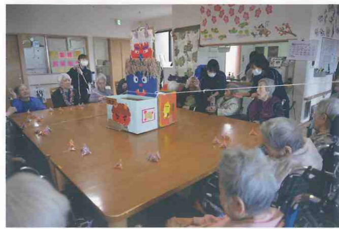
↑ グループホーム恵 (徳島市・春日1丁目) 節分の定番、豆まきを玉入れゲームにアレンジしました！カゴを狙うもよし、オニに当てるもよし、「鬼は外、福は内！」の元気な掛け声があちこちから上がります。豆まきのあとは魚釣りゲームを行いました。