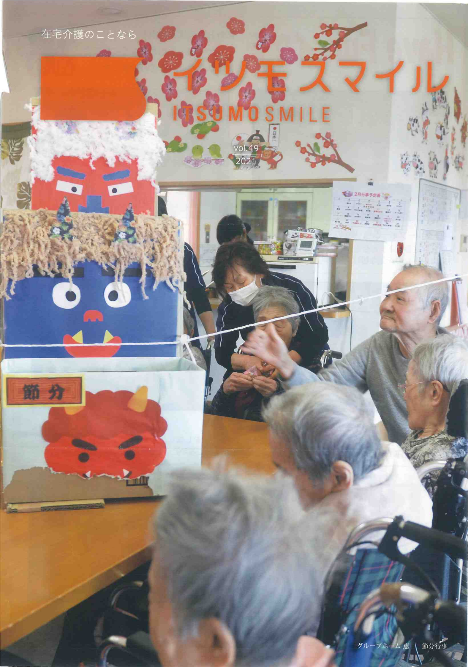
グループホーム 恵 節分行事