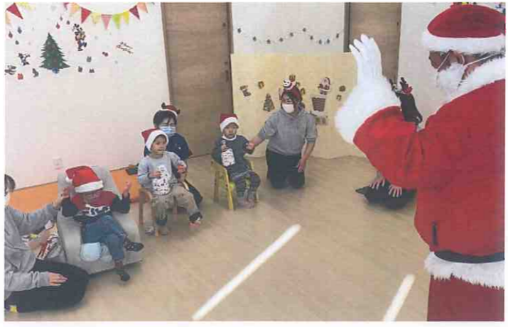
↑ 児童発達支援事業所いつもすまいる (徳島市・佐古二番町) ・みんなで作ったリースで飾りつけをして、歌をうたいながらサンタさんをお迎えしました。サンタさんからのプレゼントは何かない？ (^)/