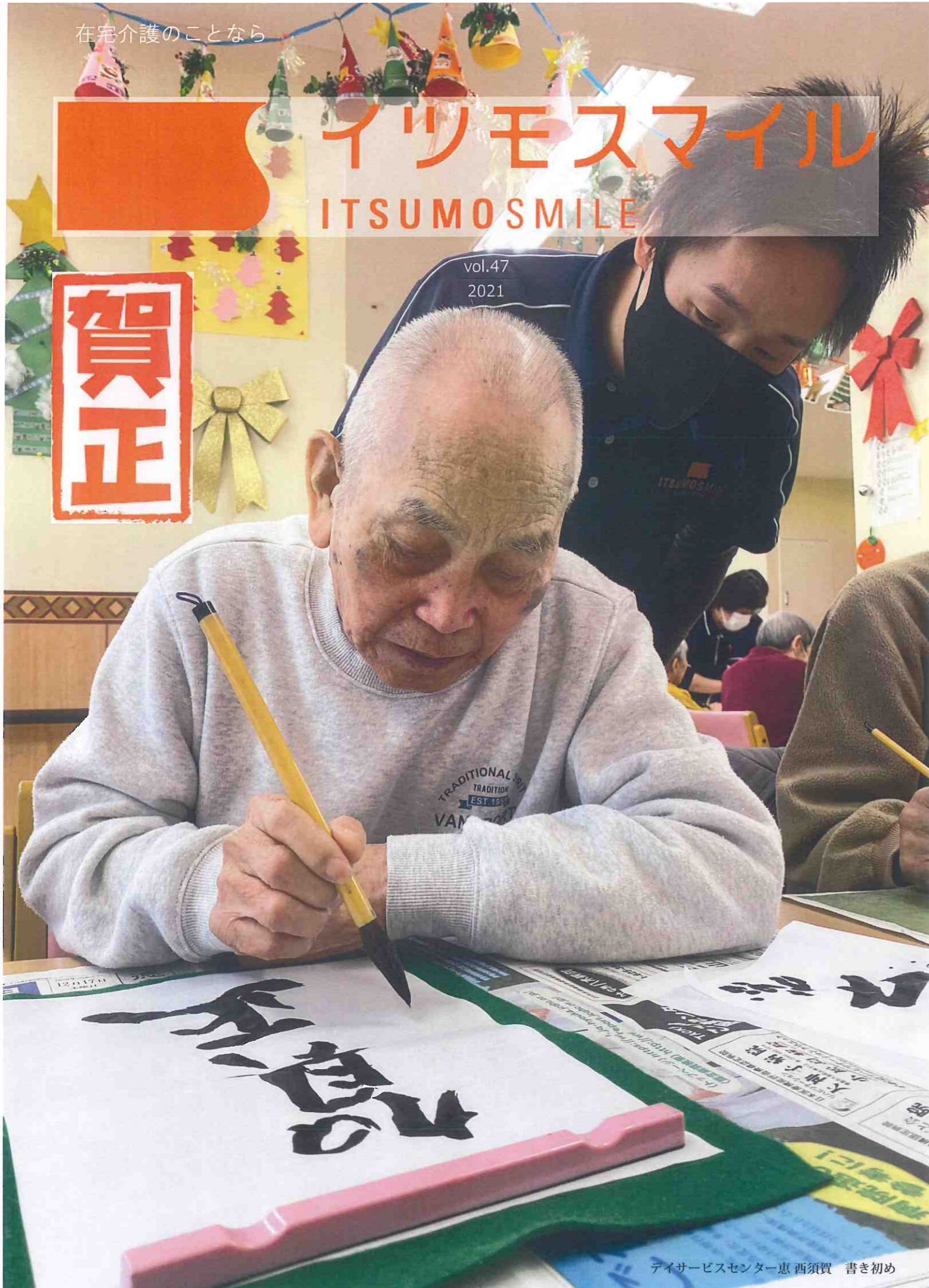
デイサービスセンター 恵 西須賀 書き初め