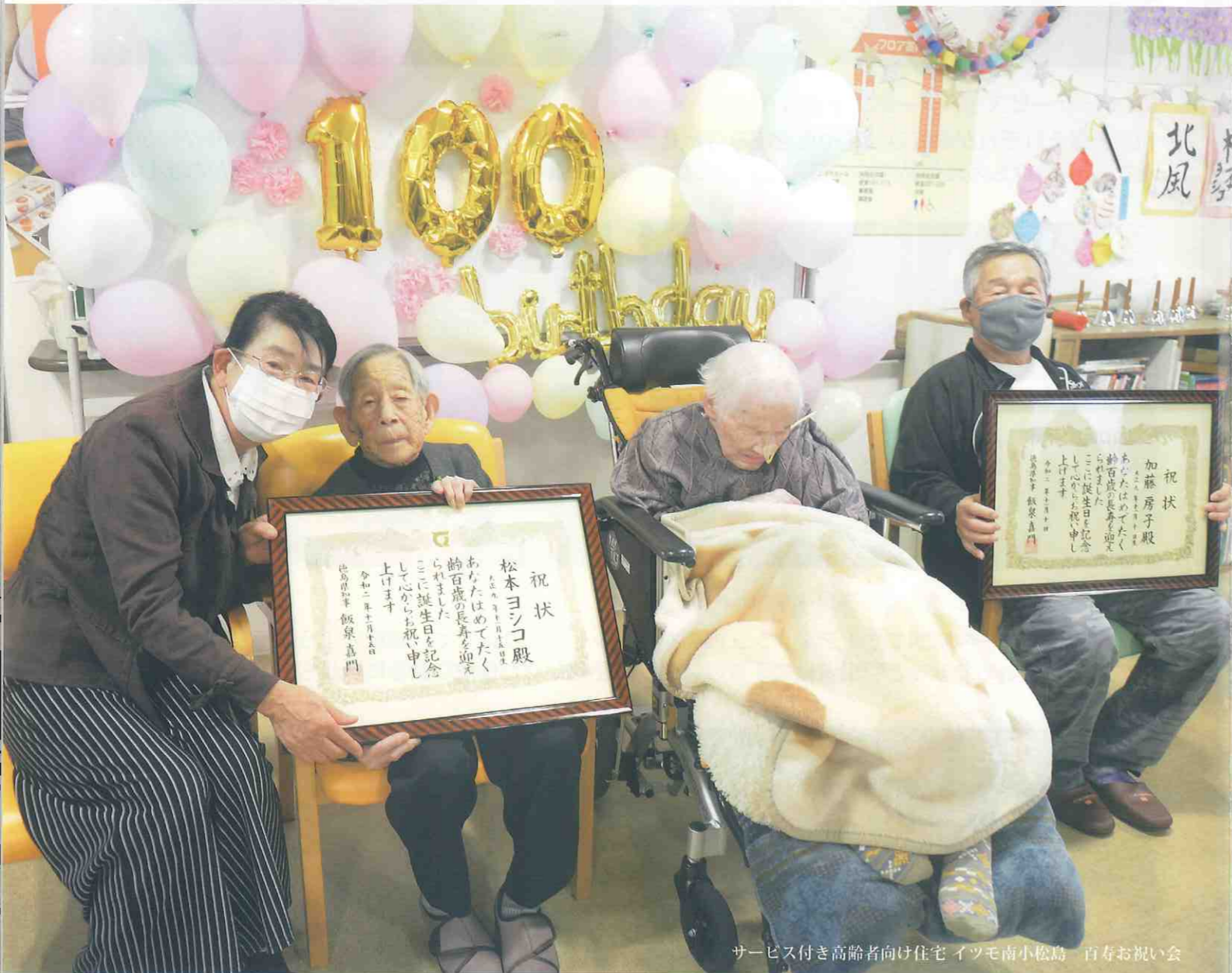
サービス付き高齢者向け住宅 イツモ南小松島 百寿お祝い会