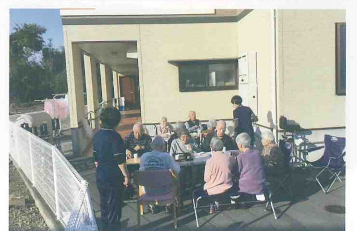
① デイサービスセンター 恵 西須賀 (徳島市・西須賀町)

毎年恒例焼きいも大会を行いました。付きっきりで焼き加減をお手伝いして頂いた利用者様が「昔は落ち葉で作ってた」「ストーブの上で作ってた」と思い出話をされ皆さんで盛り上がりました。