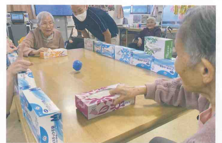
① デイサービスセンター 恵 南小松島 (小松島市・大林町)

テーブルホッケーの時間です！ティッシュの箱をラケット替わりにして、卓球のようにラリーをするゲームです。いざ始めてみると利用者様の手首のスナップを効かせた俊敏な動きに職員もびっくりしました。