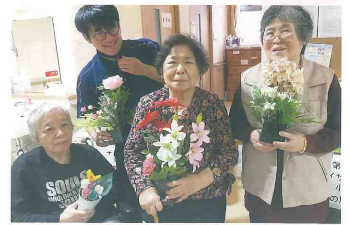
① デイサービスセンター 恵 小松島 (小松島市・中田町)

利用者様それぞれがお好みの花や葉を組み合わせた造花を作り、展覧会を開催しました。『作りがいがあったなあ』『今度もええ作品をつくらんといかん』『また頑張ろう！』など活気溢れる声が聞かれました。