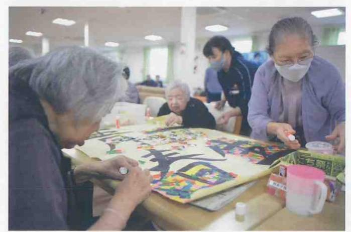
① デイサービスセンター イツモスマイル (徳島市・北田宮一丁目) 習字が得意な職員が書いた文字の周りに様々な色の切り紙を張り付け、秋色の壁画づくり！別の日には、玄関先にはおなじみの「とくし丸」。柿やりんご、秋の果物が色鮮やかでとても美味しそうでした。