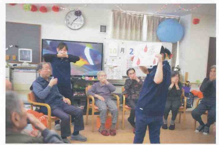
① デイサービスセンター ともだち倶楽部 (徳島市・中常三島町) 地震・雷・火事ゲーム！職員が掲げる「お題」に合ったジェスチャーをしていただくゲームです。ご自身の手を地震の時は手を頭の上に、雷の時は手をおへそに、火事の際は手を口にもっていきます。