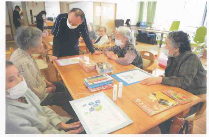
① デイサービスセンター 恵 (徳島市・仲之町) 11月のカレンダーを作りました。思い思いの配色でイラストや数字を塗っています。「来月は何の絵かいな？」カレンダーを色鉛筆で塗りながら、利用者様の賑やかなおしゃべりはいつまでも続いていました。