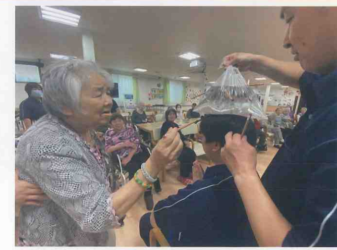
↑ デイサービスセンター イツモスマイル (徳島市・北田宮) 職員の頭上には水風船！！そこに利用者様が鉛筆を刺していく瞬間は、割れてしまわないかハラハラドキドキ！女性職員による山本リンダのものまねショーでは、利用者様も手拍子しながら口ずさまれていました。