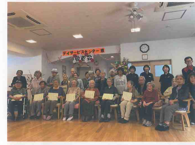
↑ デイサービスセンター 恵 (徳島市・仲之町) 7名のお祝い年の方々に記念状をお贈りしました。パンダに扮した職員が髷ダンスやリンボーダンスを披露すると利用者様も飛び入り参加！音楽に合わせて輪投げも行い、笑い歓声で大盛り上がりでした☆