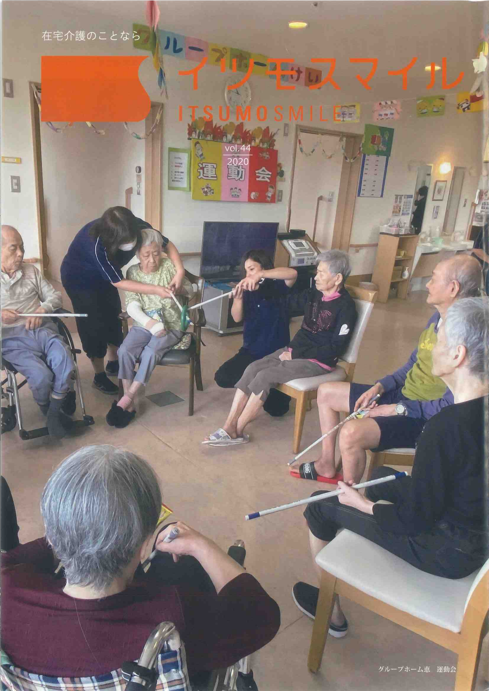
グループホーム恵 運動会