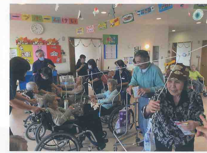
↑ グループホーム 恵 (徳島市・春日町) 秋の運動会を行いました！紐にぶら下がったお菓子の袋をキャッチするのはなかなか難しいものです。ユニット別のチーム戦を行い、楽しい時間を過ごされて満足された表情でした♪