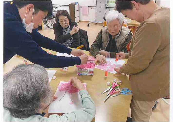
↑ デイサービスセンター イツモスマイル (徳島市・北田宮) 「花咲か爺さん」を迎える準備。桜の花びらに見立てたピンク色の紙で一足早いお花見をしました。

それぞれのデイサービスでは外出を控えているので、屋内で楽しめるレクリエーションに注力しています。