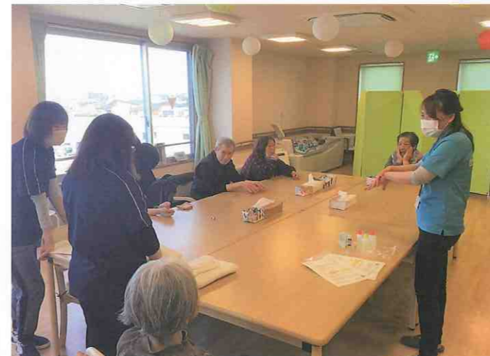
↑ デイサービスセンター 希 (阿南市・宝田町) 四国大学講師によるエッセンシャルオイルを使ったアロマセラピーマッサージを行っていただきました。

新型コロナウイルスの感染拡大 する中、外出の自粛を求める自治 体が増えてきました。今回は利用 者様と介護職員が屋内で一緒に取 り組める心身の活性化ポイントを 専門の講師からお伝え頂きます。