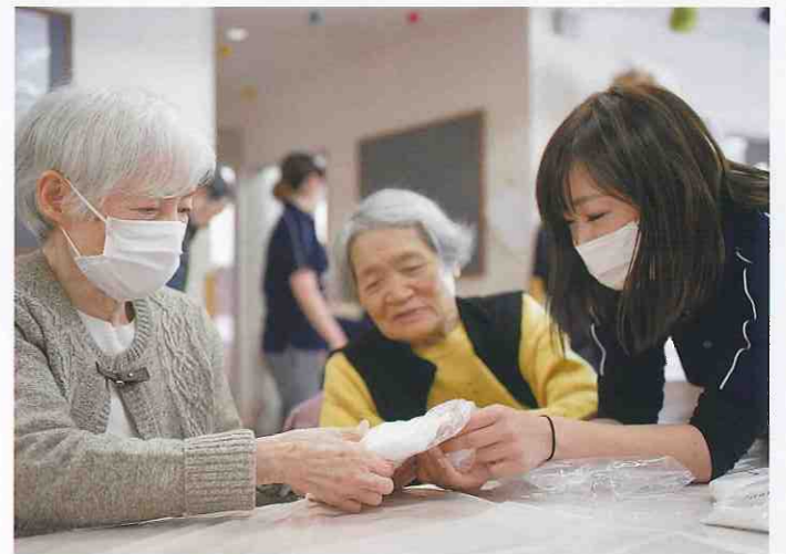
↑ デイサービスセンターともだち倶楽部 (徳島市中常三島) 今月号の表紙でもある「うどん作り」の1コマ。麺棒で伸ばす前にコシを出す作業「中もみ」が大事です！