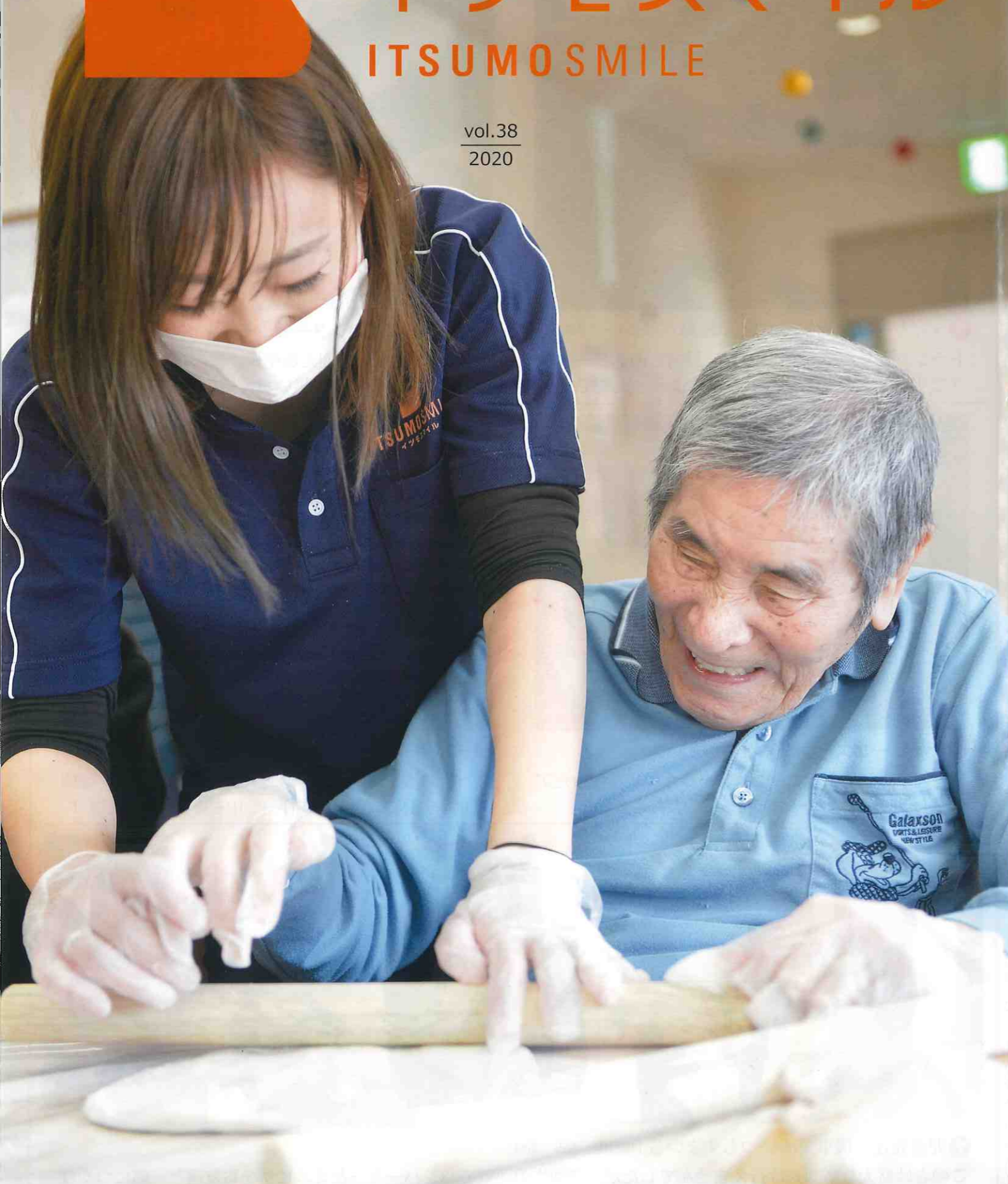
デイサービスセンターともだち倶楽部 うどん作り (中常三島)