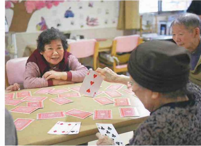
↑ デイサービスセンター 恵 小松島 (小松島市・中田町) トランプゲーム「神経衰弱」で記憶力のトレーニングです。誰よりも多くペアを揃えようと真剣です！