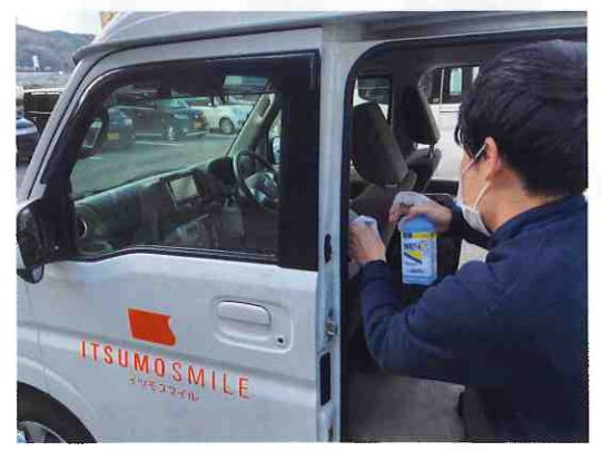
↑ デイサービスの送迎後は、利用者様が触れる部分全てを拭き取り除菌します。(デイサービスセンターイツモスマイル・北田宮町)

次亜塩素酸水はアルコール消毒と同様にコロナウイルスの除菌にも有効で、次亜塩素酸ナトリウムと比べ10倍以上の除菌能力を持ち、厚生労働省から「人の健康を損なうことがない」と安全性が認められ、「注目されているアイテム」です。 今回は各事業所で行っている次亜塩素酸水等を用いたウイルス対策の様子をご紹介します。