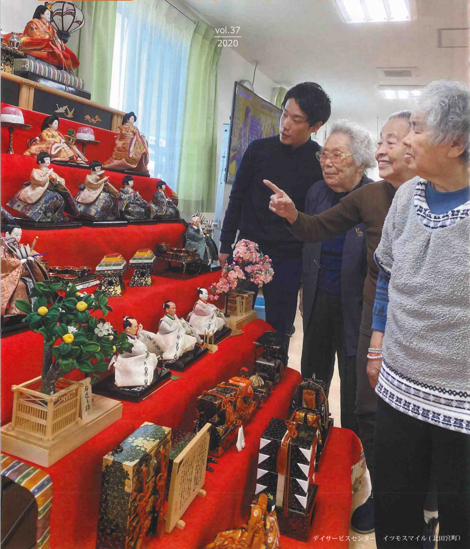
デイサービスセンター イツモスマイル (北田宮町)