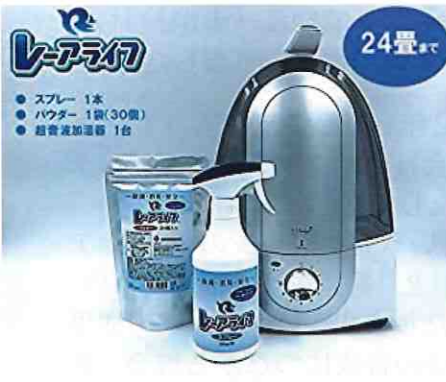
レーアライフ家庭用セット (噴霧器・パウダー・スプレー)

各事業所に次亜塩素酸水を使った「レーアライフ」噴霧器を設置することで空間除菌を行い、利用者様や職員の健康維持に努めています。使い方は簡単で、次亜塩素酸パウダーを噴霧器タンク内の水に溶かしスリッチを入れるだけで強力な除菌力・強力な消臭力があります。 また、人の手が触れる場所にはレーアライフスプレーでの消毒がオススメです。今、品薄状態が続くアルコール消毒液と同等の効果があります。 イツモスマイルでは利用者様の健康と安全を守るためにウイルス感染症対策を積極的に行っています。