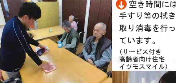
↑ 空き時には手すり等の拭き取り消毒を行っています。(サービス付き高齢者向け住宅イツモスマイル) ↑ テーブルや椅子など利用者様の肌が触れる部分は時間を決めて除菌しています。(デイサービスセンターともだち倶楽部)

空気が乾いた部屋はウイルスが浮遊する可能性があるため、こまめな換気も心掛けています。