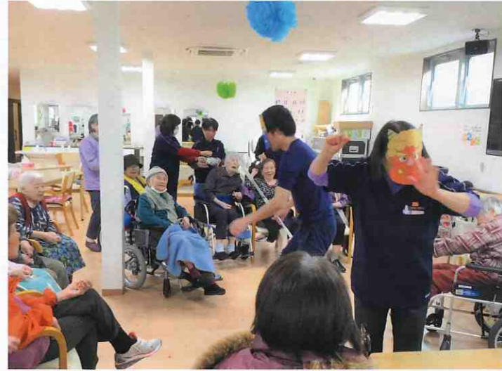
↑ デイサービスセンター イツモスマイル (徳島市・北田宮) 声を出しながら豆を投げることで利用者様もストレス発散! 健康を祈念しつつ暦の上での春を迎えました。