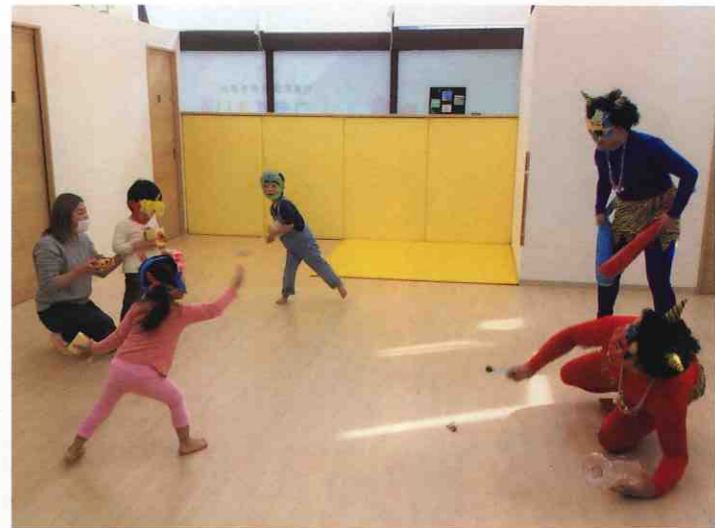
↑ 児童発達支援事業所いつもすまいる (徳島市・佐古二番町) 子どもたちは赤鬼・青鬼に負けじと豆を投げつけました。赤鬼さんを退治した瞬間です(笑)

今年も節分の豆まきを、利用者様とともに行いました。豆をまいて季節のかわりめの邪気をはらい、福を内に取り込んで、利用者様全員の無病息災、ご長寿を願いました。