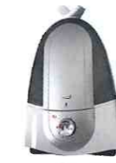
① レーアライフ 超音波式噴霧機 (標準型) 家庭用 5.5L