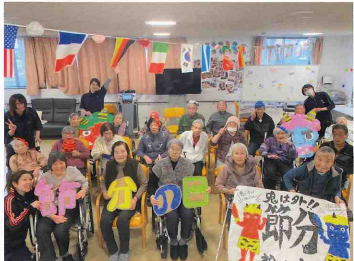
↑ デイサービスセンター恵 南小松島 (小松島市・大林町) イベント行事恒例の工作レクリエーションです。利用者様手作りの作品を持って、「鬼は外、福はうち」!