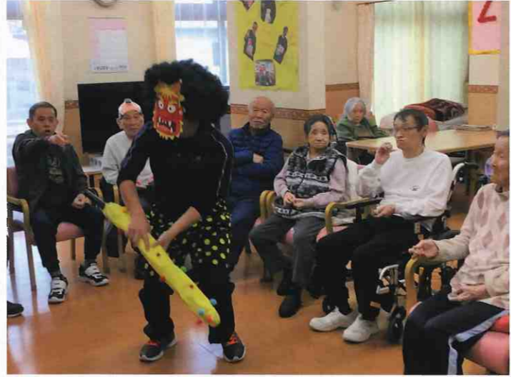
↑ デイサービスセンター恵 西須賀 (徳島市・西須賀町) 職員が扮した鬼が「鬼が来たぞー!」と勢よく入ってきましたが、利用者様が投げる豆に降参状態。