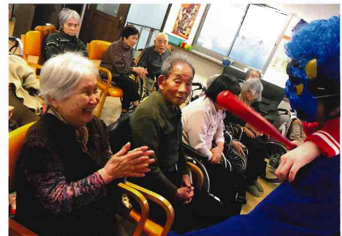
↑ デイサービスセンター 恵 南小松島 (小松島市・大林町) 節分の豆まき。赤鬼・青鬼さん、来年はもう少し頑張らして怖がらせてください！