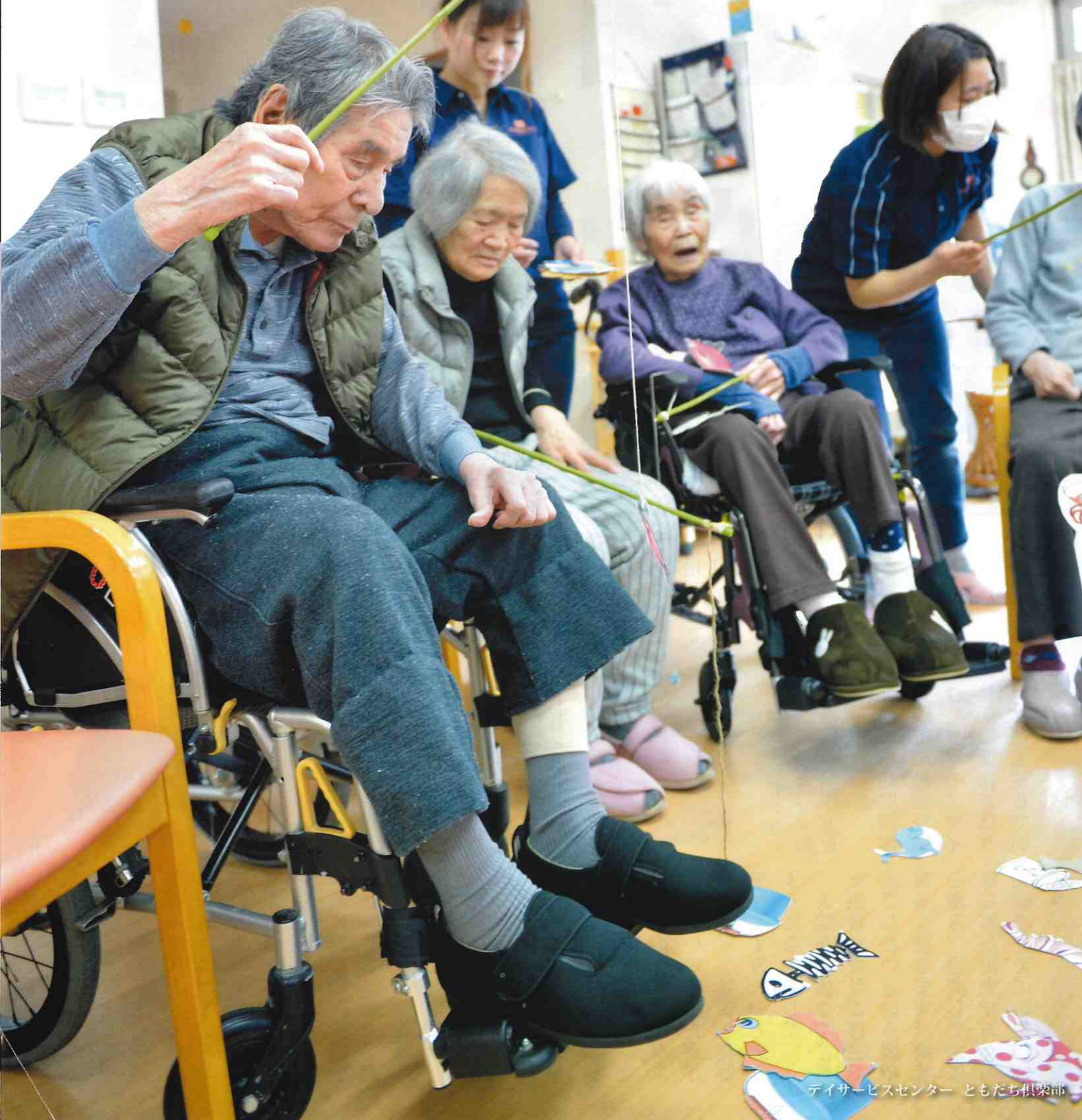
デイサービスセンター ともたち倶楽部