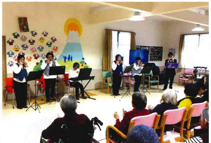
↑ デイサービスセンター 恵 小松島 (小松島・中田町) 小松島ハーモニカクラブの方々が慰問に来て下さりました。