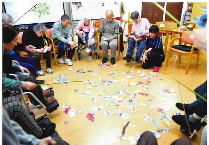
↑ デイサービスセンター ともだち倶楽部 (徳島市・中常三島) 竿を片手におさかな釣りゲーム！足で引き寄せるのはルール違反ですよー (笑)