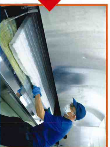
④洗浄中にマットレスが重なる事がないので、隅々まで洗浄できます。機械内での脱水作業に移ります。