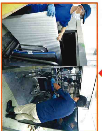
⑦洗浄・脱水を終えたマットレスはトラックに載せられマットレス乾燥機に運ばれます。車椅子は人が入れるほどの大型乾燥機で乾燥させます。

介護・医療の仕事といえば、施設などでご利用者様のお世話をする介護スタッフを思い浮かべると思いますが、メンテナンス部門では、直接的にご利用者様と接することはありませんが、福祉用具を通じてご利用者様を笑顔にできる仕事です。回収されてきた福祉用具を洗浄、消毒、修理を行う仕事のため、直接ご利用者様と会話することはなくとも、提供する福祉用具ひとつひとつは、必ずご利用者様の安心や笑顔につながると考え日々取り組みをしています。