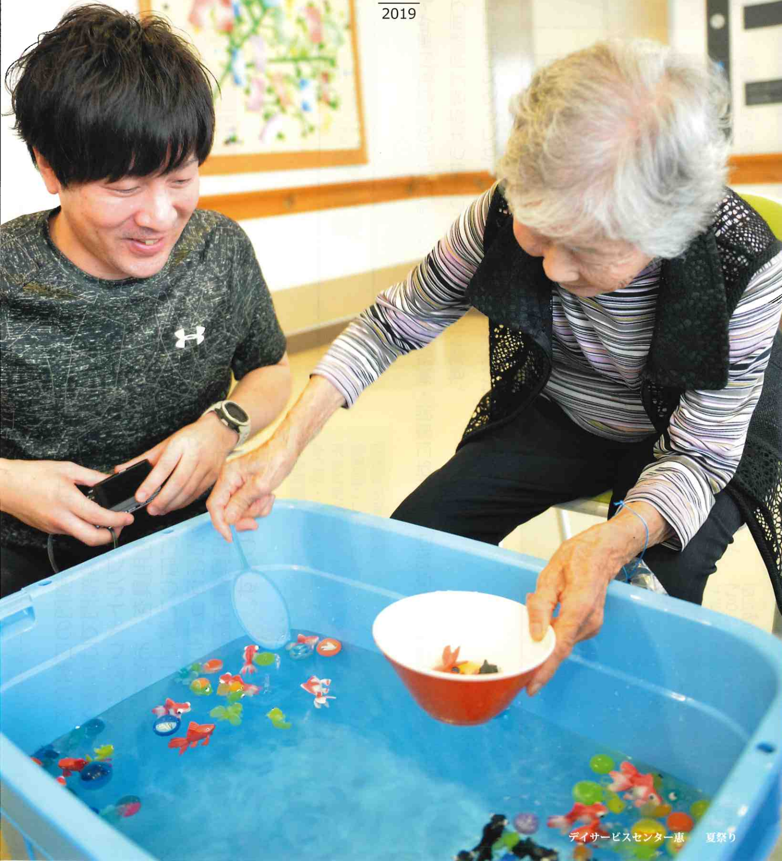
デイサービスセンター恵 夏祭り