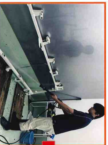
①高圧洗浄機を使用し、小さなゴミやホコリ、汚れを全て除去します。分解されたベッドを高圧洗浄機で洗浄しているところです。

弊社では、介護用ベッドや車いすなどの福祉用具レンタル商品の洗浄・消毒において、回収されてきた福祉用具を、清潔で安心な福祉用具として再利用できるようにメンテナンスを行います。技術や経験を要する作業は専門のスタッフが、新品同様の状態に整備いたします。