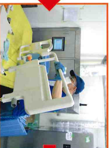
②ベッドはパーツごとに分解されます。画像はサイドレールを手洗いで洗浄しているところです。