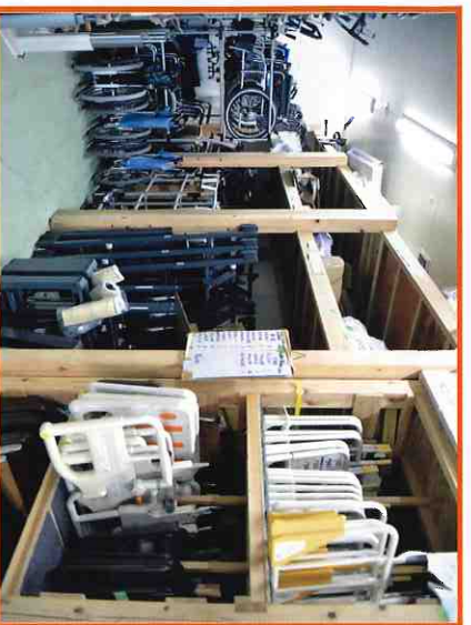
⑤一連の工程を通じた福祉用具は、清潔な管理倉庫で保管されます。梱包は、福祉用具本体や各部品に傷をつけないためだけでなく福祉用具専門相談員が安全に運びやすく、また開梱しやすいようにしています。