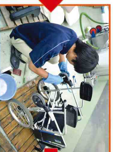
③車椅子や歩行器などは手に触れる部分やタイヤの細かな部分まで手洗いで確実に洗浄します。