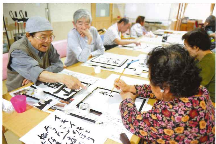
↑ デイサービスセンター 恵 小松島 書道を通じて楽しみながら手指のリハビリ。皆さん思い思いの言葉を書かれて楽しんでいました。