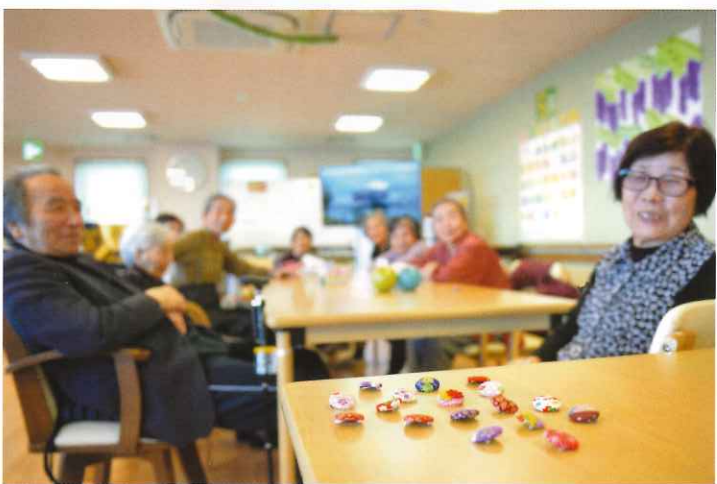
↑ デイサービスセンター 希 ブローチ作りに挑戦!! 細かい作業に苦戦しながらも、綺麗なブローチが出来上がりました。