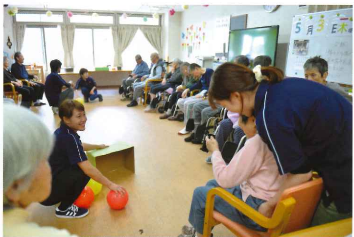
↑ デイサービスセンター ともだち倶楽部 いよいよワールドカップの開催を目前に控え、デイサービスでフットサル大会を開催!!