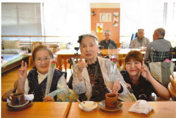
↑ デイサービスセンター 恵 利用者様に母の日のプレゼント。これからも健康で元気にデイサービスに来てください!!