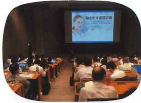
【基調講演1】 遠隔診療の課題と期待