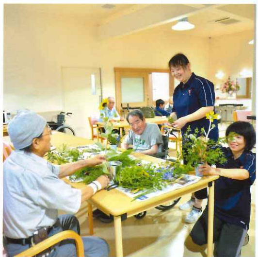
↑ デイサービスセンター恵 小松島 生け花風景 デイサービスの利用者様と生け花をしました。皆さん上手にされていました。