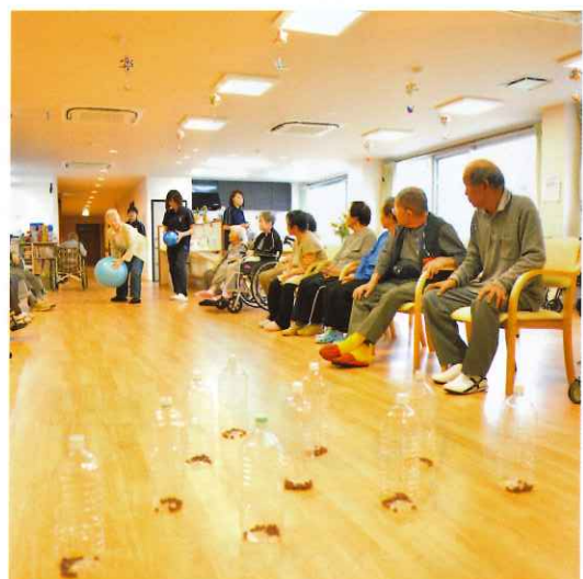
↑ デイサービスセンター希 ボウリング風景 個人戦チーム戦に分かれてのボウリング。ピンがたくさん倒れると歓声があがりました。