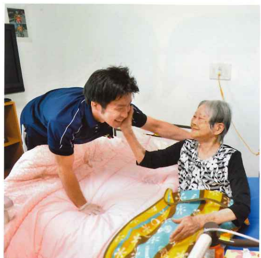
↑ イツモ田宮 ヘルパー風景 とても仲が良い二人。ヘルパーの時間も、仲が良すぎて話が絶えません(笑)